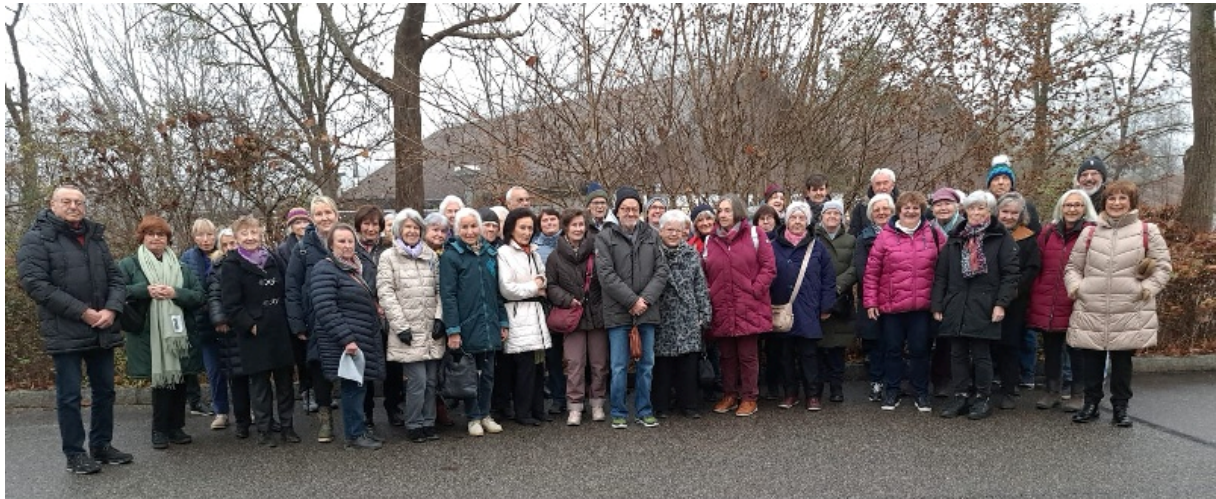
Die Gruppe des Kneipp-Vereins in Altötting.