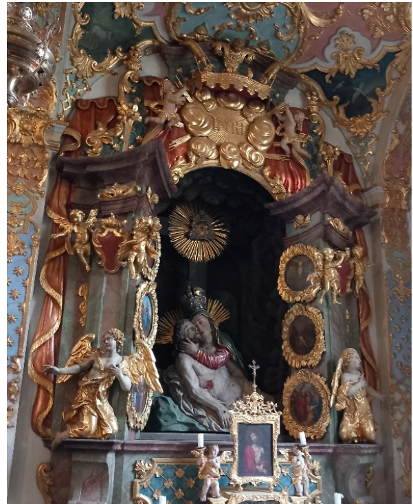
Foto rechts: Pietà Seitenaltar in der Kirche Mariä Himmelfahrt und St. Felicitas

Ein Schock für die Bevölkerung! Zum Glück überstanden die Deckengewölbe den Brand, ohne einzubrechen. Jedoch eine fast 10-jähriger Sanierungsarbeit war nötig, das Gotteshaus in altem Glanz wieder erstehen zu lassen. Die Sakristei aus dem Jahre 1691, noch im Originalzustand erhalten, mit wunderbaren Holzschnitzarbeiten und Deckenmalereien, konnte zum Abschluss auch noch besichtigt werden. Eine Pause mit Mittagessen in dem im August 2024 wiedereröffnetem, renoviertem Bräustüberl, das die Franziskanerinnen mit einem Kauf gerettet hatten, war angesagt. Das alte Stüberl dessen originale Einrichtung zu 97% nebst historischem Kachelofen erhalten blieb, sowie zwei weitere helle Räume bieten reichlich Platz. Auch die Wirtschaftsräume sind auf dem modernsten Stand. Das berühmte Dunkel-Bier wird jetzt nach altem Rezept in Seon gebraut und auch den berühmten