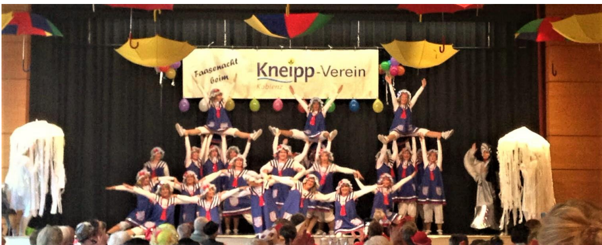
Die „Hupfdohlen“ des Mohnenvereins „Fidele Mädcher“ Wallersheim