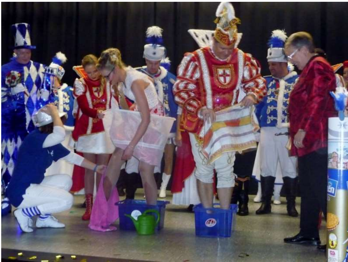
Prinz und Confluentia beim „Wassertreten“